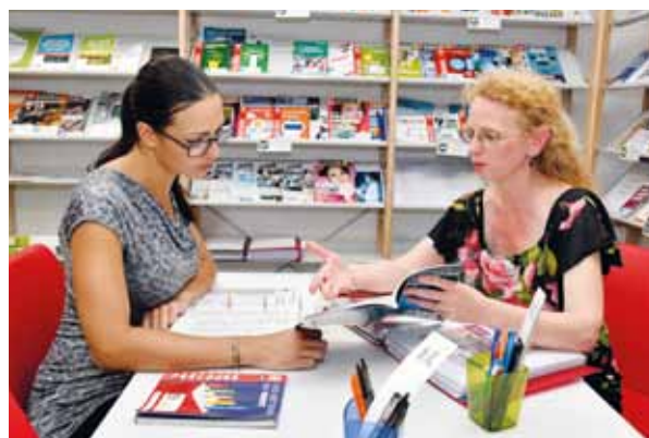
Les documentalistes du CIEN conseillent et orientent un public varié, allant des bacheliers aux personnes en reconversion professionnelle.

Il lui appartient également d'assurer une veille documentaire sur les filières d'enseignement des établissements publics et privés, ainsi que sur les nouveaux cursus de formation et diplômes