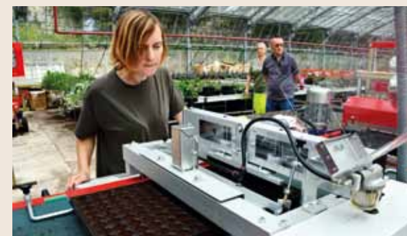
Un semoir automatisé permet de mieux contrôler les temps de culture.