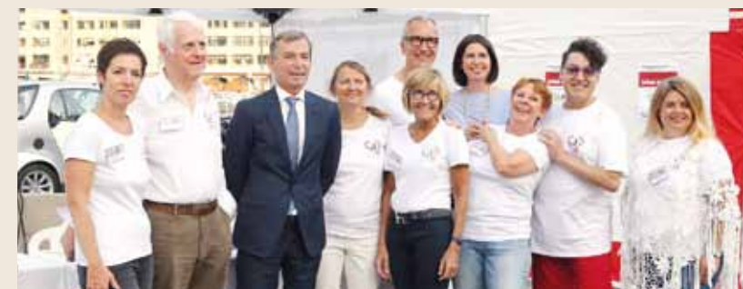
Fight Aids Monaco a organisé son opération annuelle de dépistage du VIH « Test in the City » le 15 juin, en présence de S.A.S. la Princesse Stéphanie et de Didier GAMERDINGER. Afin de rendre le dépistage et la prévention plus accessibles aux jeunes en cette période estivale, l'opération s'est déroulée pour la première fois de 19h à 2h du matin sur la Darse Sud du Port Hercule. L'équipe de Fight Aids Monaco a accueilli de nombreux jeunes dans les tentes situées entre la piscine Rainier III et la Brasserie de Monaco. Elle a effectué les tests avec la technique du TROD (Test Rapide à Orientation de Diagnostic), qui permet d'obtenir un résultat fiable en quelques minutes. Le Service des Urgences du CHPG s'est également associé à l'opération en proposant lui-aussi ce soir-là un dépistage du VIH.