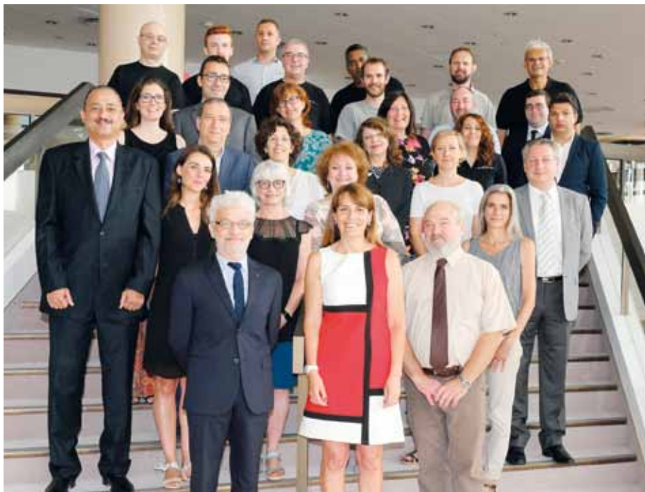
La DAC regroupe au total quelque 54 personnes.

La Direction des Affaires Culturelles (DAC) a pour mission de porter la voix du Gouvernement Princier dans le domaine de la culture, notamment en soutenant les activités artistiques de la Principauté et en veillant à la conservation du patrimoine national. Détail des attributions, présentation de l'organisation et découverte des activités d'un Service administratif qui impulse un secteur cher au pays.