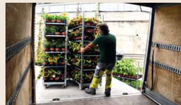
Transport des végétaux depuis la pépinière vers les différents secteurs de la Principauté.