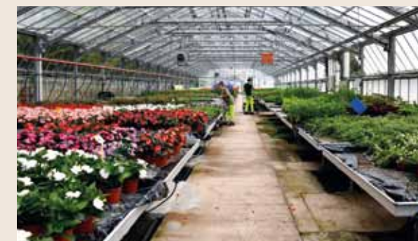
Une serre de production automatisée pour la gestion de la climatologie et de l'arrosage.