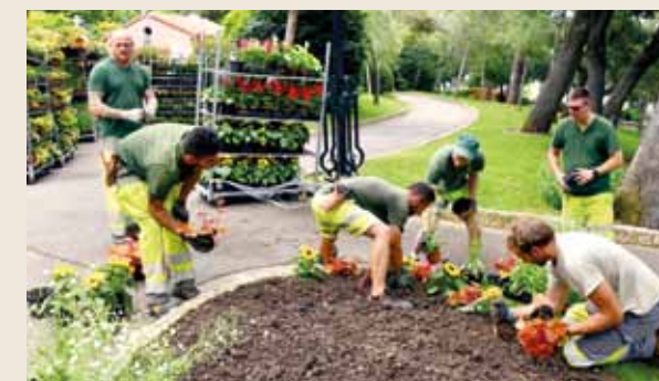
Plantation d'un massif d'annuelles dans les Jardins Saint-Martin.