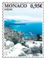
Impression : Offset Format du timbre : 30 x 40,85 mm vertical Tirage : 45.000 timbres-poste Feuille de 10 timbres-poste avec enluminures Valeur faciale : 0,95 €