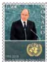
Impression : Offset Format du timbre : 30 x 40,85 mm vertical Tirage : 45.000 timbres-poste Feuille de 10 timbres-poste avec enluminures Valeur faciale : 1,30 €

En juin, l'OETP a procédé à la mise en vente des timbres suivants :