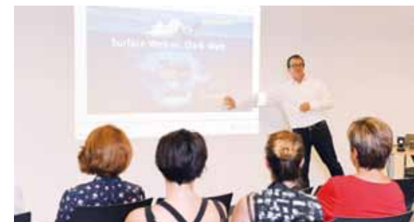
Deux séances de sensibilisation à l'adresse des Directeurs, Chefs de Service et Adjointes ont déjà eu lieu les 4 et 6 juillet.

La sensibilisation et les formations initiales et continues sont un des objectifs de la Stratégie nationale pour la sécurité du numérique.