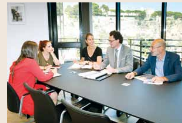
à la même adresse, au 2A Boulevard des Moulins.

Pour autant, les touristes ne seront pas dépayés puisque l'accueil et l'information du public demeurent toujours