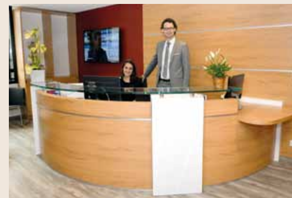
L'essentiel des Pôles de la Direction du Tourisme et des Congrès a déménagé au mois de juin dans de nouveaux locaux à l'Athos Palace, situé à Fontvieille au 2 rue de la Lujerneta. Après 47 années passées dans l'emblématique bâtiment de Monte-Carlo,

c'est un nouveau départ pour les équipes qui assurent la promotion internationale de la Principauté.